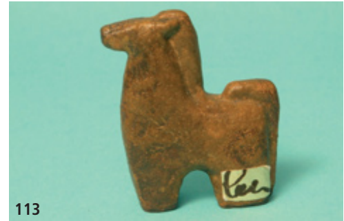
113 Pferd, Modell P 10, Höhe 8,5 cm

In kleinerem Umfang wurde im Atelier Schäffenacker auch figürliche Keramik hergestellt. Es handelt sich dabei meistens um abstrakte Tierfiguren, die in unterschiedlichen Größen und Glasurvarianten ausgeführt wurden. Diese Keramik hat man aus feinschamottiertem Schlicker gegossen, ganz selten, wie etwa die Pferdegruppen, von Hand ausgeformt. Einige Modelle, darunter die Pferdegruppen, wurden auch in Bronze gegossen. Figürliche Großkeramiken wurden nicht hergestellt. Modellnummern sind auf den Figuren nicht vorhanden. Sie sind nur in den Verkaufskatalogen zur Organisation der Bestellungen aufgeführt. Größere Figuren zeigen gelegentlich eine Ritzsignatur des vollständigen Namenszuges oder auch den Namen als mitgegossenes Relief. Häufig hat sich auch das Signaturetikett erhalten. Ein erfolgreiches Modell wurde der „Ulmer Spatz“, ein abstrakt ausgeformtes Vogelmodell. Daneben gibt es auch einzelne Figuren und Figurengruppen, oft als Unikate.