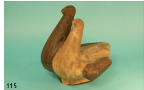
115 Taubenpaar P 21, Höhe 21,0 cm