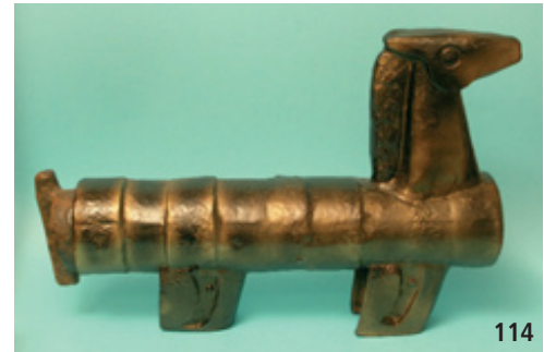
114 „Trojanisches Pferd“, Keramik gegossen, vom Künstler schwarz-bronzen gefasst, Schwanz als Deckel abnehmbar, Signaturetikett, Höhe 31,5 cm, Länge 45,0 cm